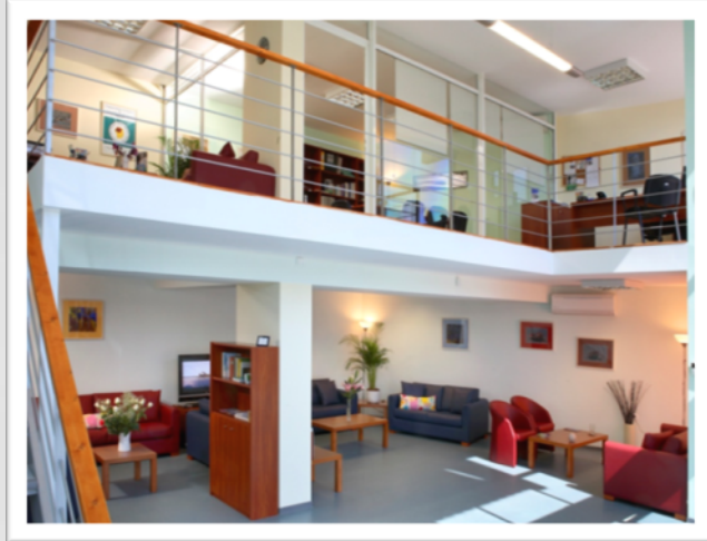
Κέντρο Ημέρας για ανοϊκούς ασθενείς Μ. Μουσούρου 89 & Στίλπωνος 33, Μετς Τηλ. 210 7013271