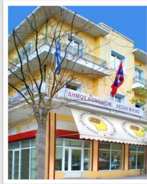
Κέντρο Ημέρας για ανοϊκούς ασθενείς Πανόρμου και Βαθέως Αμπελόκηποι Τηλ. 210 6424228